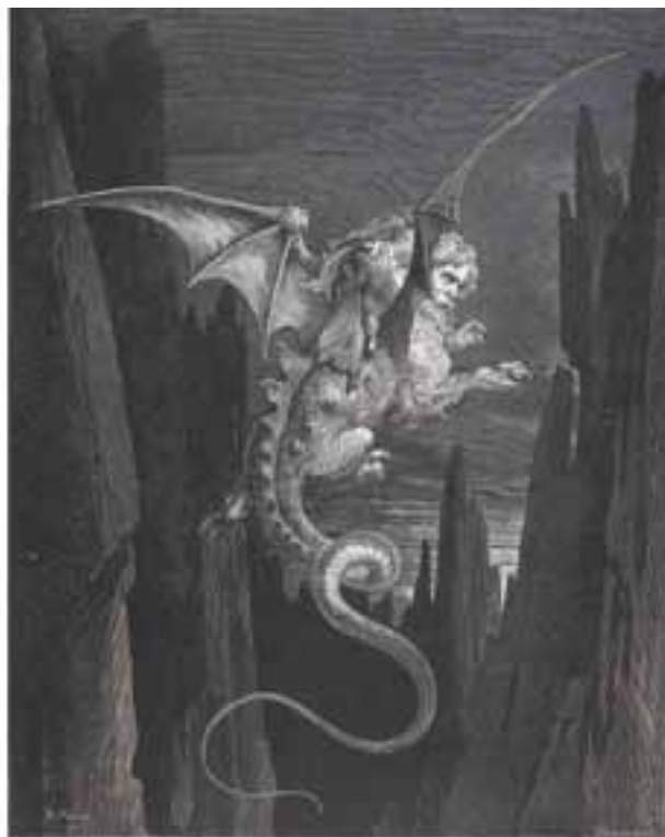
Gustave Doré, L'Enfer

Le Petit Palais invite dans ses murs la Bibliothèque nationale de France pour cette grande première sur l'estampe fantastique. Plus de 170 oeuvres de Goya à Redon en passant par Delacroix et Gustave Doré introduiront le visiteur dans cet univers omniprésent dans la gravure et la lithographie du XIXe siècle. Du macabre au bestiaire fantastique, ou au paysage habité, jusqu'à la représentation du rêve ou du cauchemar : le triomphe du noir !