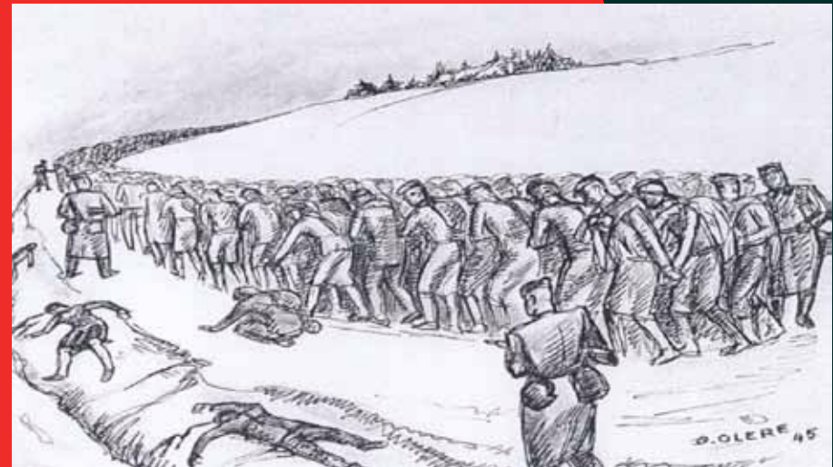
Les Marches de la mort, David Olère, 1945.